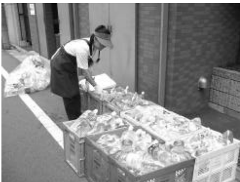
写真 回収ステーションでのPETボトルの分別収集風景